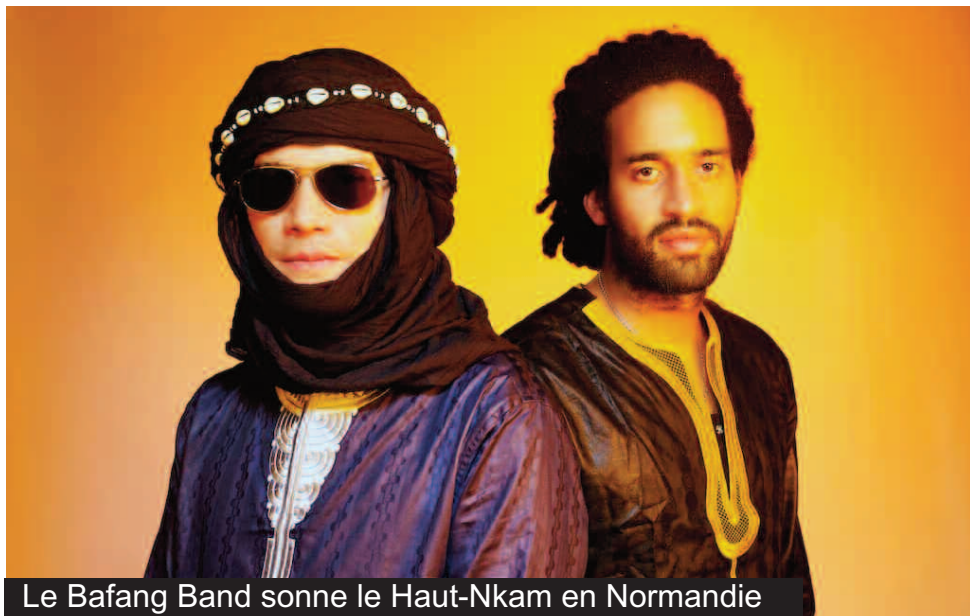
Le Bafang Band sonne le Haut-Nkam en Normandie

sa chanson à succès la main dans la main, qui fait appel à l'unité et au vivre ensemble. À travers sa voix, ses compositions et prestations, l'on peut d'une certaine manière voyager au cœur de la culture du Haut-Nkam, car le groupe Ma'a Mega, au-delà de son histoire, est tout un patrimoine du panthéon culturel Grassfields au Cameroun. Ici, c'est des femmes proches de la tradition et des réalités locales qui scandent leur mérite. Pour d'autres