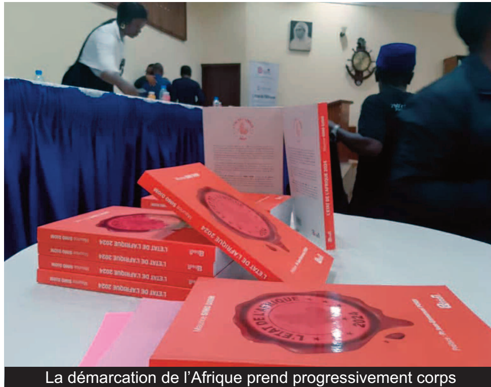
La démarcation de l'Afrique prend progressivement corps

qui travaillent les sociétés africaines, et savoir où est ce que les sociétés africaines vont et comment elles se déploient », laisse-t-il entendre, très engagé.