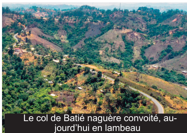
Le col de Batié naguère convoité, aujourd'hui en lambeau

Suite à l'impraticabilité de cette route, devenue entretemps un véritable clavaire, pour ceux qui ont tout de même l'outrecuidance de l'emprunter, les fortunes diverses ont conduit à l'interdiction d'activités pour la plupart de ces établissements. Le Centre Touristique de Batié a fermé ses portes. Quelques autres infrastructures, plus rapprochées de la ville de Bafoussam, tel le Centre Touristique de Bandjoun, jouent encore les prolongations, dans une perspective peu reluisante, du fait de la stagnation,