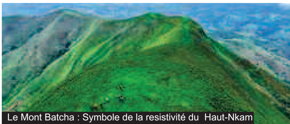
Le Mont Batcha : Symbole de la résistivité du Haut-Nkam

Cette sensibilité, à fleur de peau, cette horreur pour les injustices et les iniquités, constituent des schèmes caractéristiques de la défiance que ce département porte en son sein, vis-à-vis du parti au pouvoir. Il s'agit d'une défiance qui tire ses origines depuis l'époque coloniale. Elle se situe