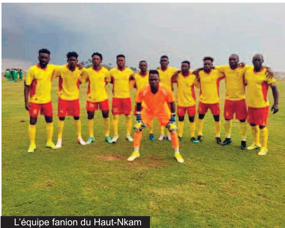
L'équipe fanion du Haut-Nkam